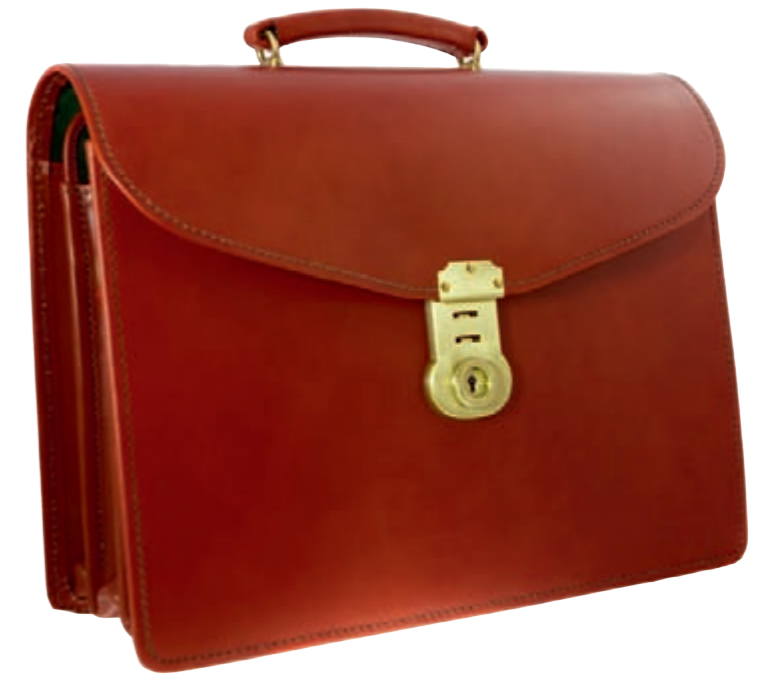
Laptoptasche 3 Fächer, Farbe Kastanie, mittleres Fach grünes Veloursleder, wattiert, für Laptop, 2 Stiftflaschen und 2 kleine Ledertaschen für Visitenkarten, 3-fach zu verschließen, Bridle-Leder (Sattelleder), Schultergurt Größe 43 x 33 x 14 cm Bestell-Nr. 60020118 € 1179,-