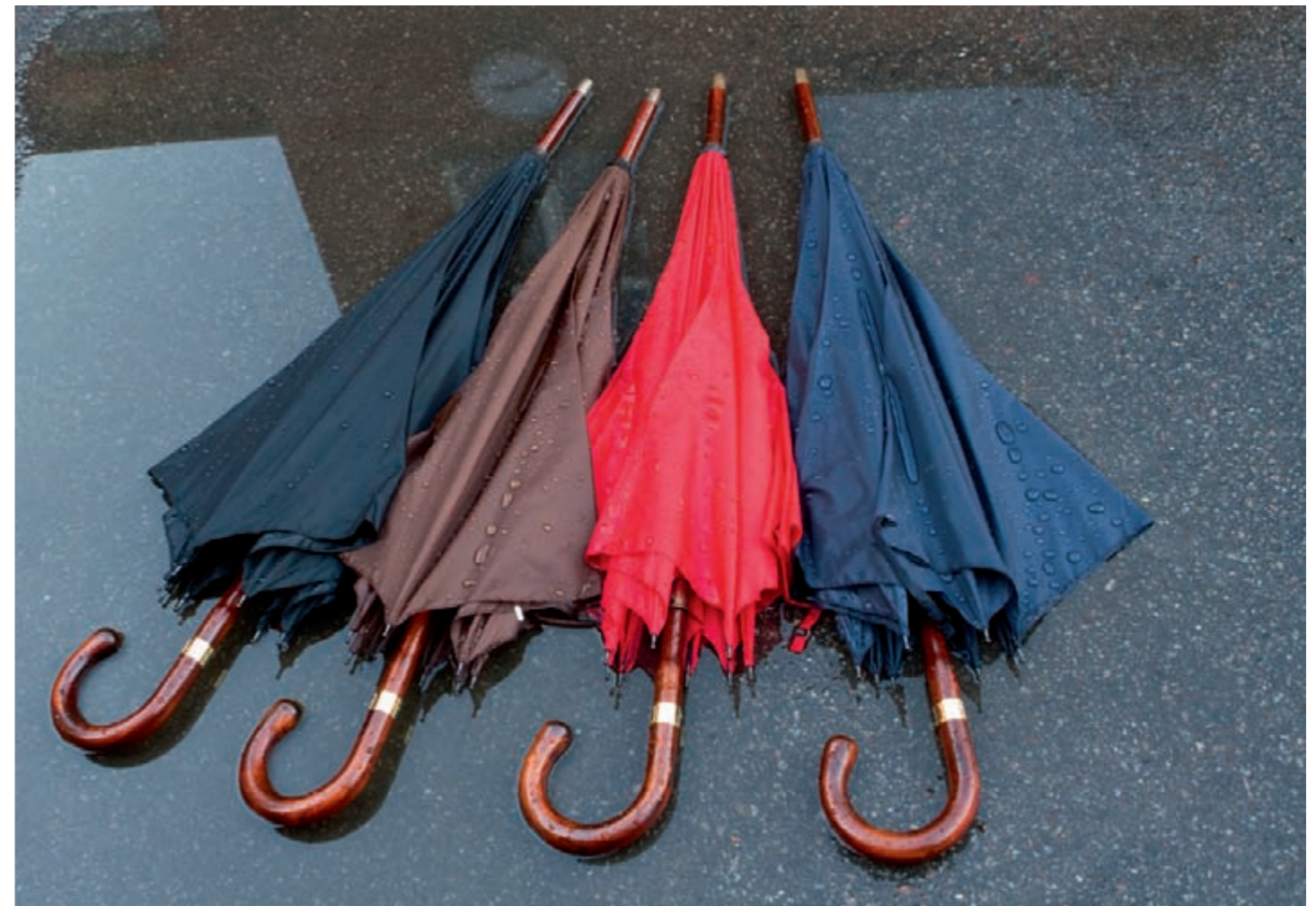
Regenschirm handgearbeitet, poliertes Kirschholz, Stocklänge 93 cm, Durchmesser Griff 2,5 cm, Speichenlänge 66 cm, Schirmspannbreite 109 cm, Gewicht 560g, Bespannung Nylon, schwarz, rot, dunkelblau, braun, Schirmhülle aus Nylon Bestell-Nr. 60020117 € 229,-