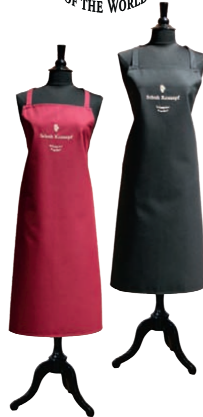
Schuh Konzept-Schürze Farbe bordeaux und schwarz Bestell-Nr. 60020399 € 49,-