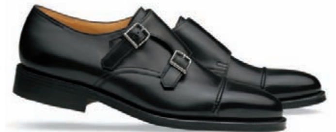
Dark Black Kendal Calf