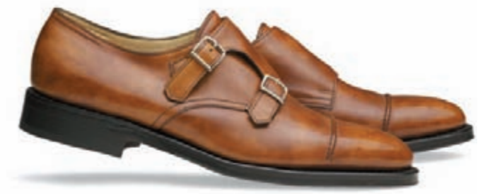
New Gold Museum Calf

Lassen Sie sich verzaubern von diesen himmlischen Schuhen.